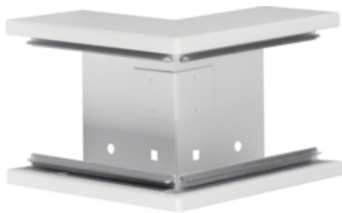
BRS, buitenhoek staal voor goot 65x100 mm, helderwit