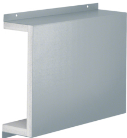
FWK schuifmof, 30/50210, verzinkt